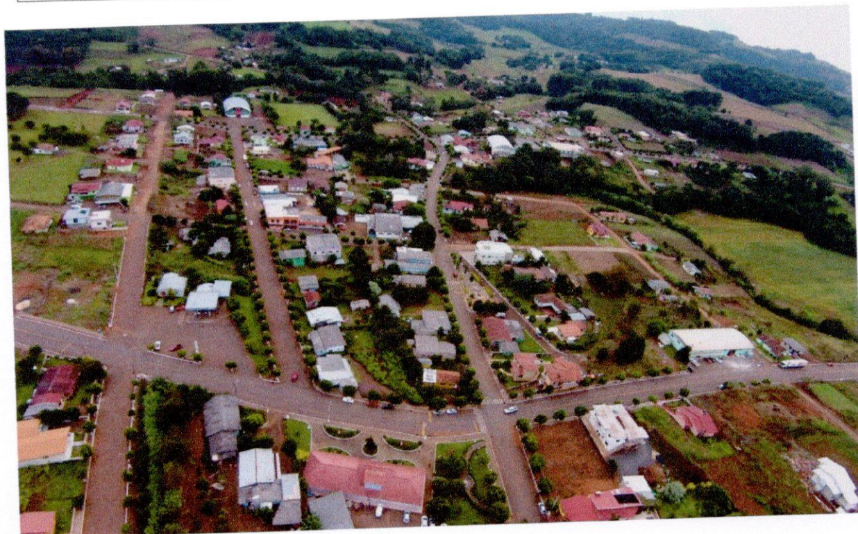
Município de Cunhataí